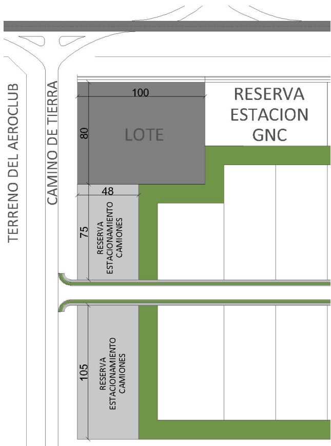
Plano del lote: